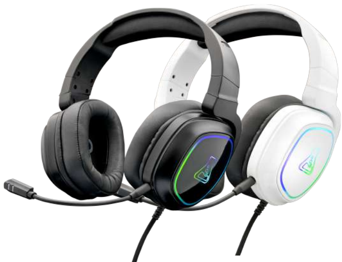
RGB Gaming Headset